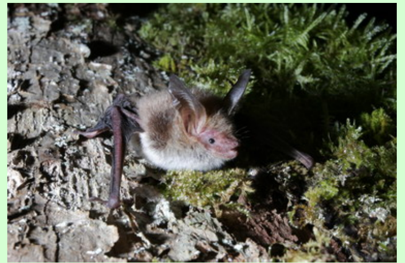
Murin de Bechstein