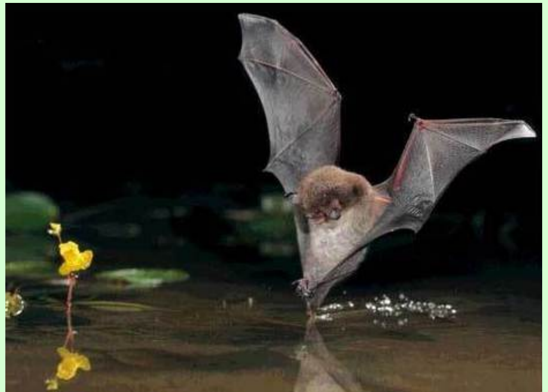
Murin de Daubenton